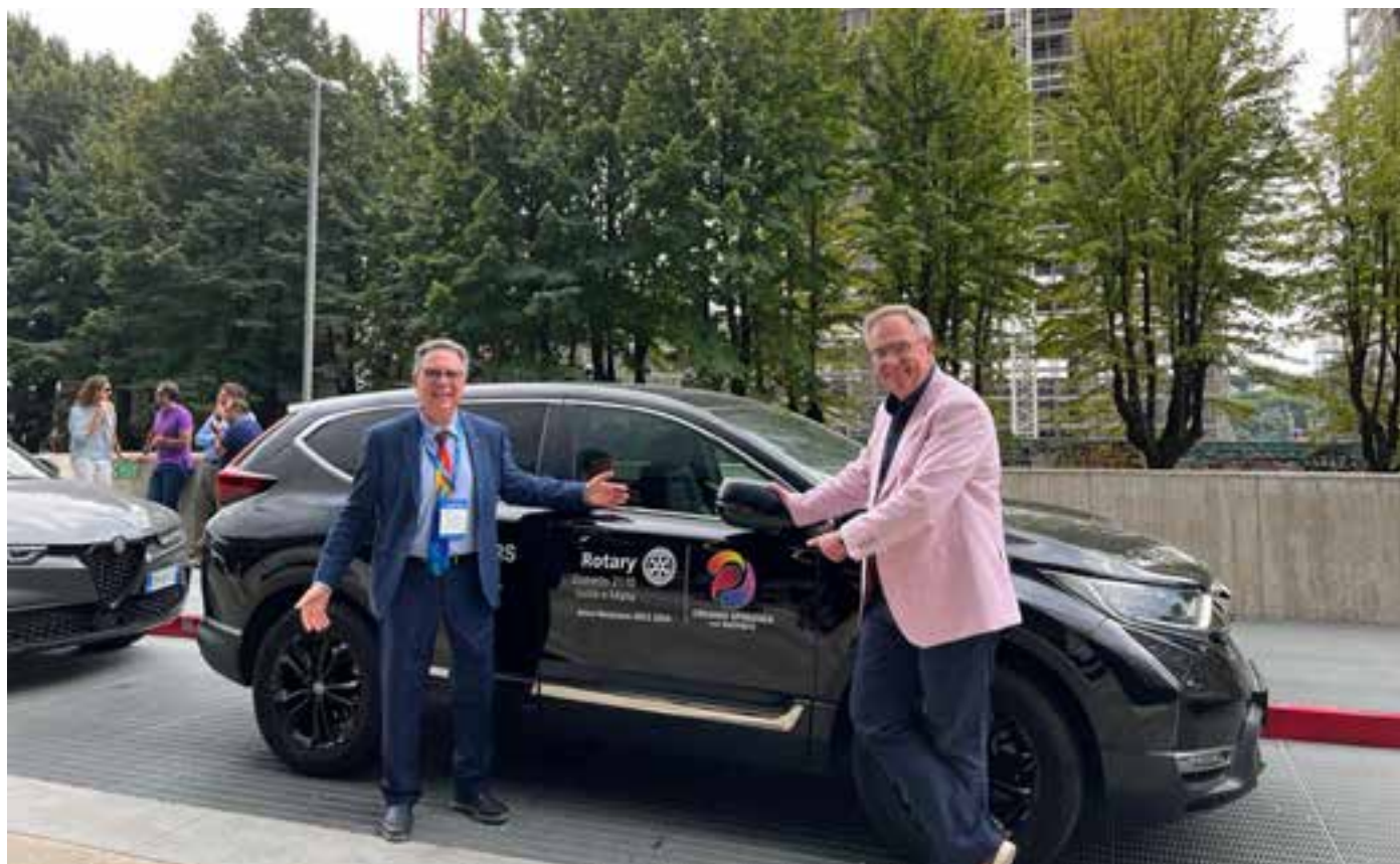
Il Distretto 2110 si muove in maniera ecosostenibile grazie al supporto di Honda Italia e della concessionaria VEGMOTORS di Palermo.