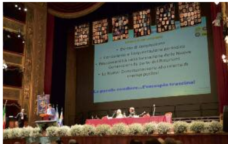
A sinistra un'immagine del concerto dell'Accademia musicale siciliana, nella serata inaugurale del congresso. A destra uno dei numerosi interventi