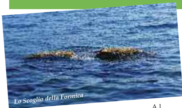
Lo Scoglio della Formica